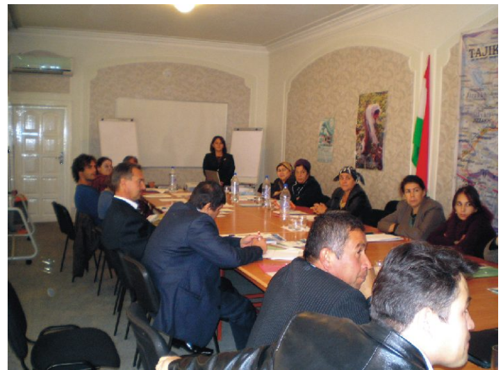
Семинар «Гендерные аспекты в управлении водными ресурсами в Республике Таджикистан»